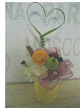
ものづく（フラワーアレンジ）