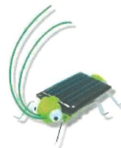
かがくたいけん 科学体験 （ソーラーバタづく）