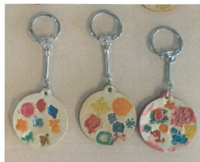
かわ キーホルダーこうさく 革キーホルダー工作