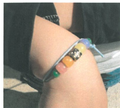
しがいせんじっけん 紫外線実験 かんち ブレスレットづく （感知ブレスレット作り）