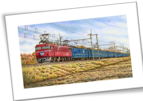
「遙かなる北の国から」(1053ピース) 鉄道風景画家・松本忠 作